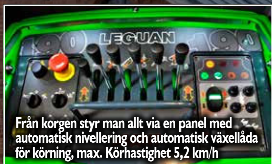
Från korgen styr man allt via en panel med automatisk nivellering och automatisk växellåda för körning, max. Körhastighet 5,2 km/h