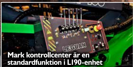
Mark kontrollcenter är en standardfunktion i L190-enhet