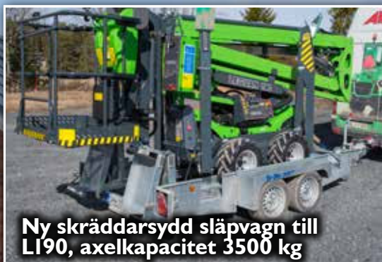
Ny skräddarsydd släpvagn till L190, axelkapacitet 3500 kg